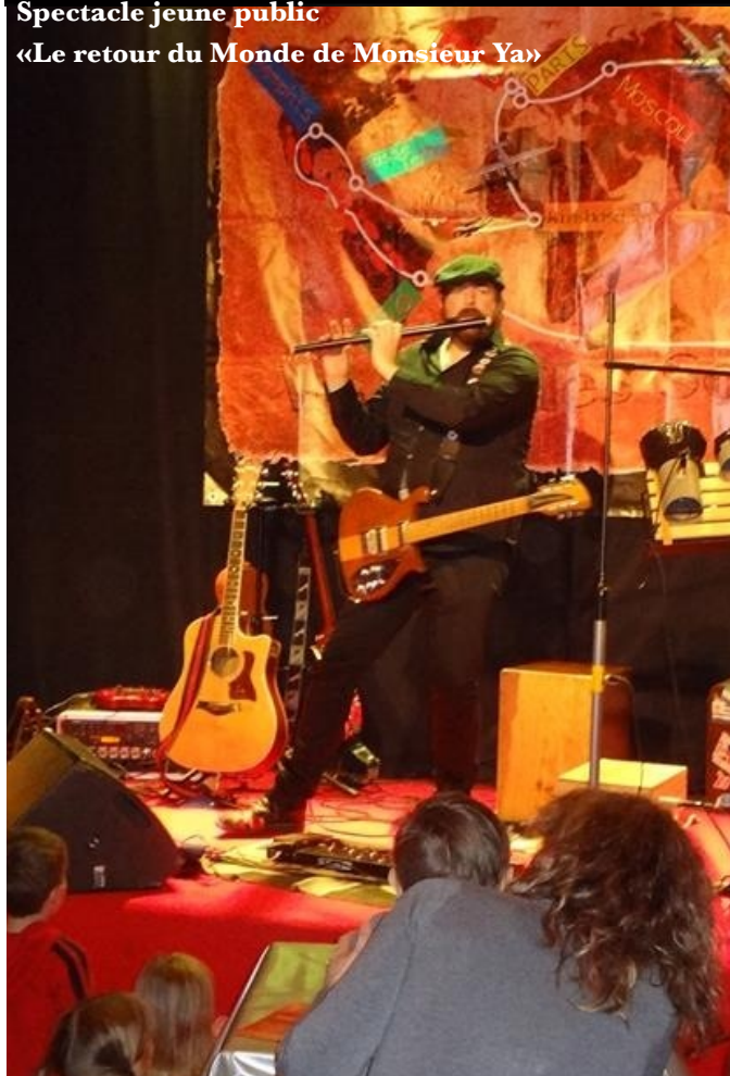
Spectacle jeune public «Le retour du Monde de Monsieur Ya»