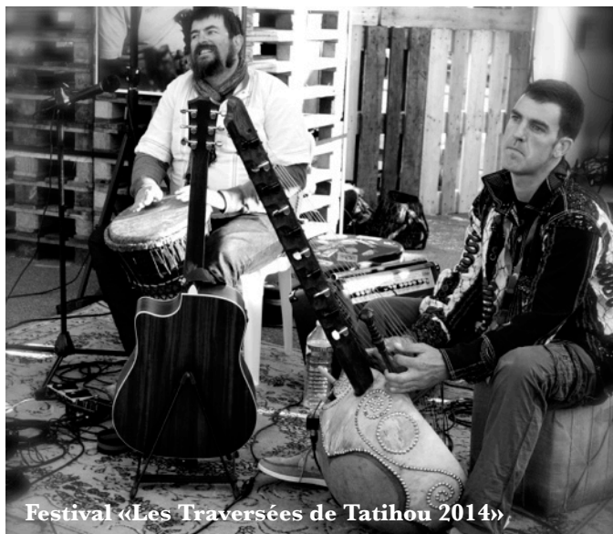
Festival «Les Traversées de Tatihou 2014»