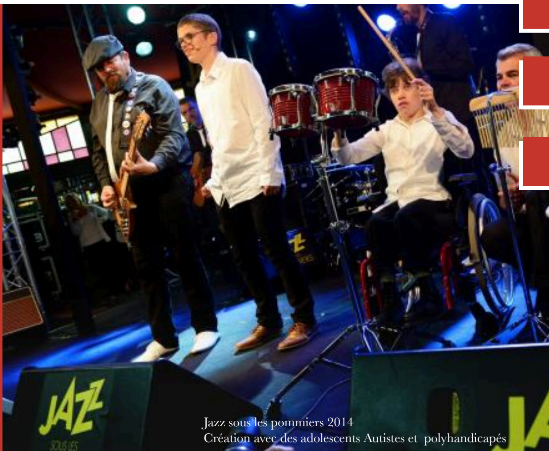
Jazz sous les pommiers 2014 Création avec des adolescents Autistes et polyhandicapés

Yannick Hervé Auteur, Compositeur, Interprète